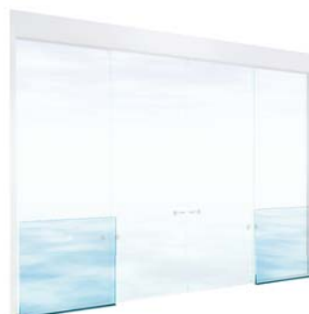
フィックスサイドガードZero

※自動ドア全般にわたる安全規格【JIS A 4722「歩行者用自動ドアセット-安全性」】